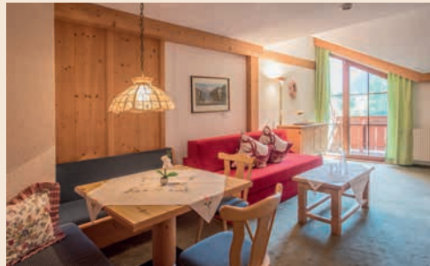
Suite Piz Buin

Die großzügigen Suiten sind liebevoll eingerichtet und strahlen Behaglichkeit aus. Hochwertige Materialien wie heimisches Holz und liebevoll abgestimmte Stoffe sorgen für eine wohlige Atmosphäre. Geräumige Suiten für traute Zweisamkeit, familiäre Aktivitäten oder ruhige Abende: das herrliche Panorama am Balkon genießen, in Erinnerungen an einen wundervollen Tag in der gemütlichen Sitzecke schwelgen oder unter der flauschigen Zudecke im bequemen Bett kuscheln. Übrigens haben alle Zimmer und Suiten großzügigen Stauraum in den Schränken und Regalen für die Winterkleidung.